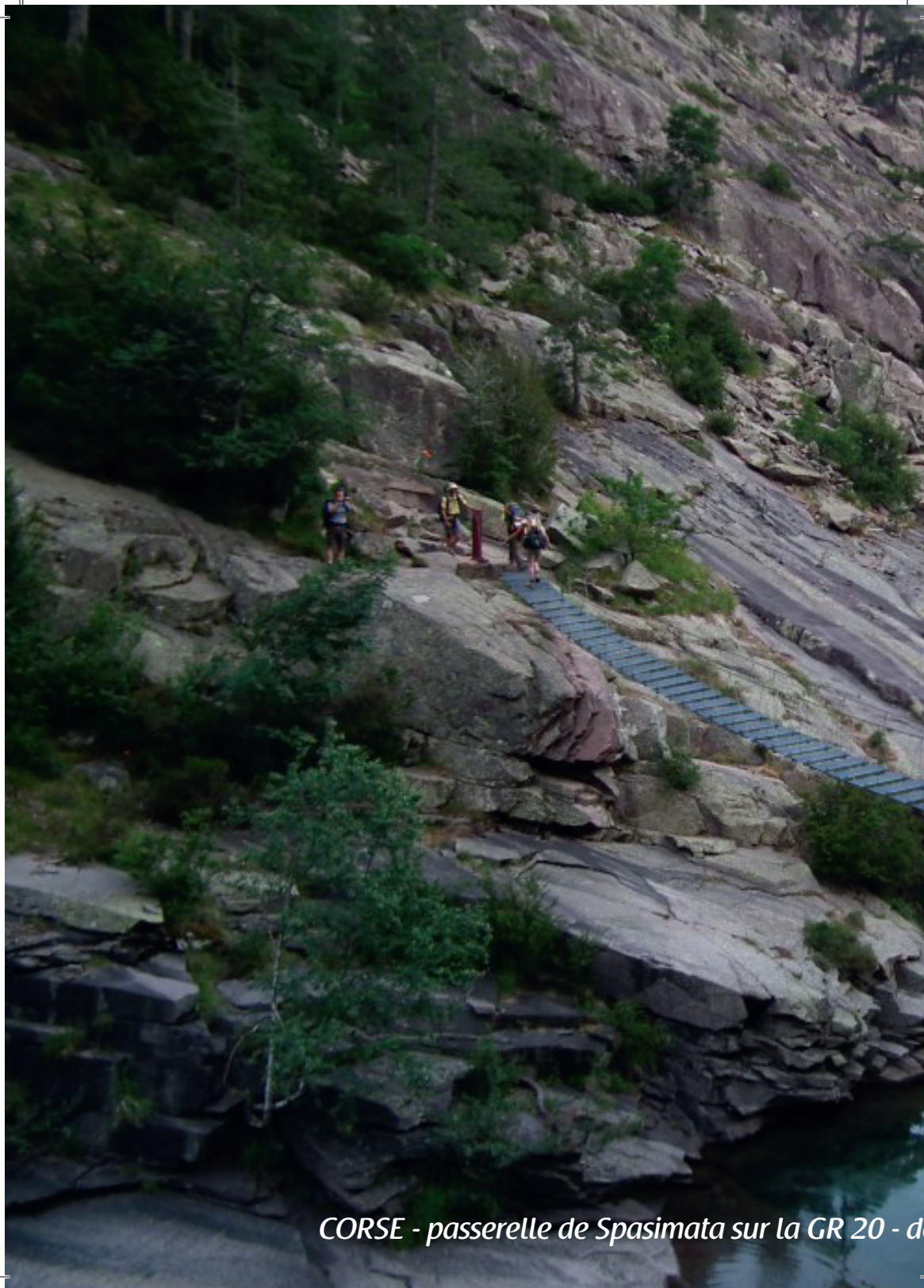
CORSE - passerelle de Spasimata sur la GR 20 - d