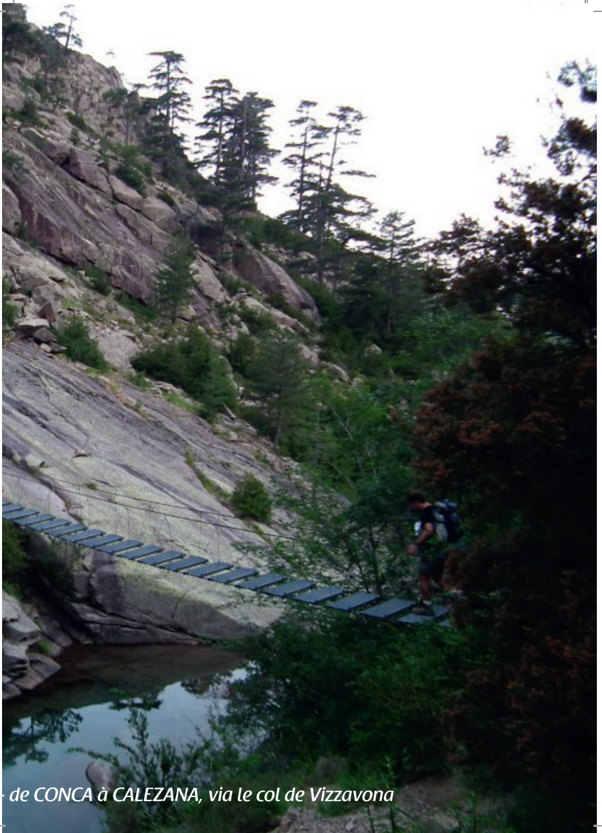
de CONCA à CALEZANA, via le col de Vizzavona